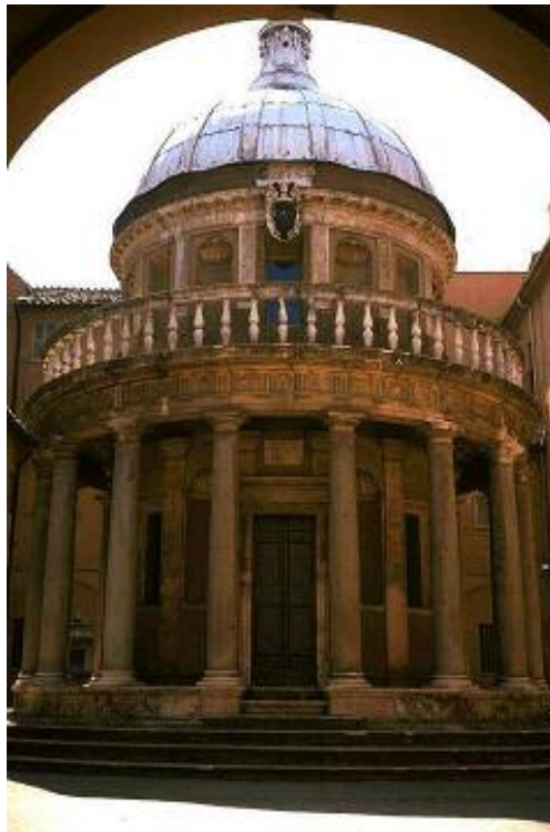
(نویژگه ی په‌رستگه ی بچوک) کلیسای پیروزمه‌ند په‌ترۆس، ۱۵۰۲ رۆما